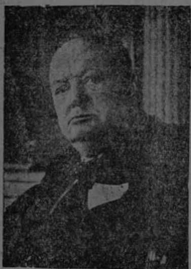
Aún lleno de juventud, quien ha cumplido ochenta y tres años. Para él y señora, nuestro saludo

a beber en el arroyo, otros danzan a la luz de la luna.